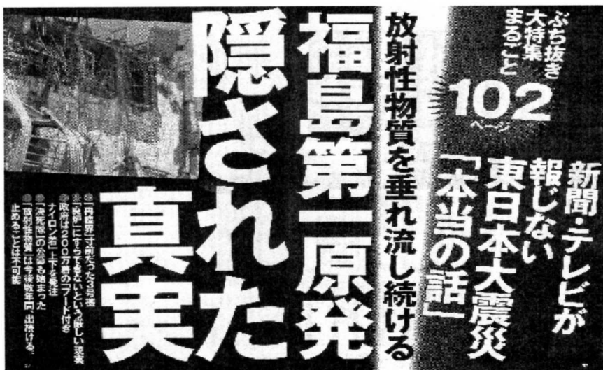
上記は週刊現代 2011年4月9日号福島原発特集ページより転載

今号は、遺伝子組み換え廃液の漏出事故を起こした武田薬品が出した正式な説明・報告書をもとに、バイオ専門家の新井秀雄博士にズバリ原因と問題点を究明して頂きました。