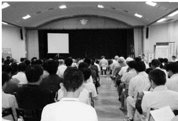
2008年7月 公聴会の全景

この頃、3月から6月に掛けて勉強会のなじみどうしを通じて集会場に集まり意見交換サークルが出来始め、中には会の名称を付けるところも出現した。(現在5~6団体)